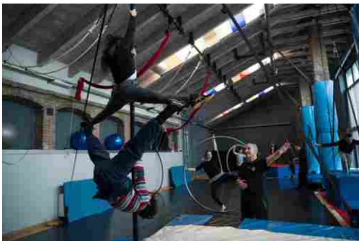
Una raccolta fondi per aiutare un'aspirante allieva della Fondazione Cirko Vertigo

Al via una raccolta fondi per aiutare una ragazza che sogna di frequentare i corsi della Fondazione torinese